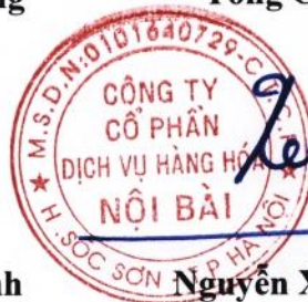
Nguyễn Xuân Phúc